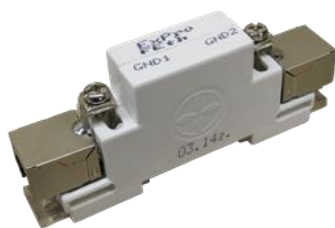
Рис.1 Внешний вид.

Применяется для защиты оборудования с интерфейсами Ethernet 10/100 BASE-TX, поддерживает передачу питания поверх данных в соответствии с рекомендациями IEEE 802.3af/at и в режиме Passive PoE. Предназначено для установки в помещении или климатических шкафах и контейнерах. Параметры устройства рассчитаны на применение в условиях высокого уровня помех. Монтаж производится на рейку DIN.